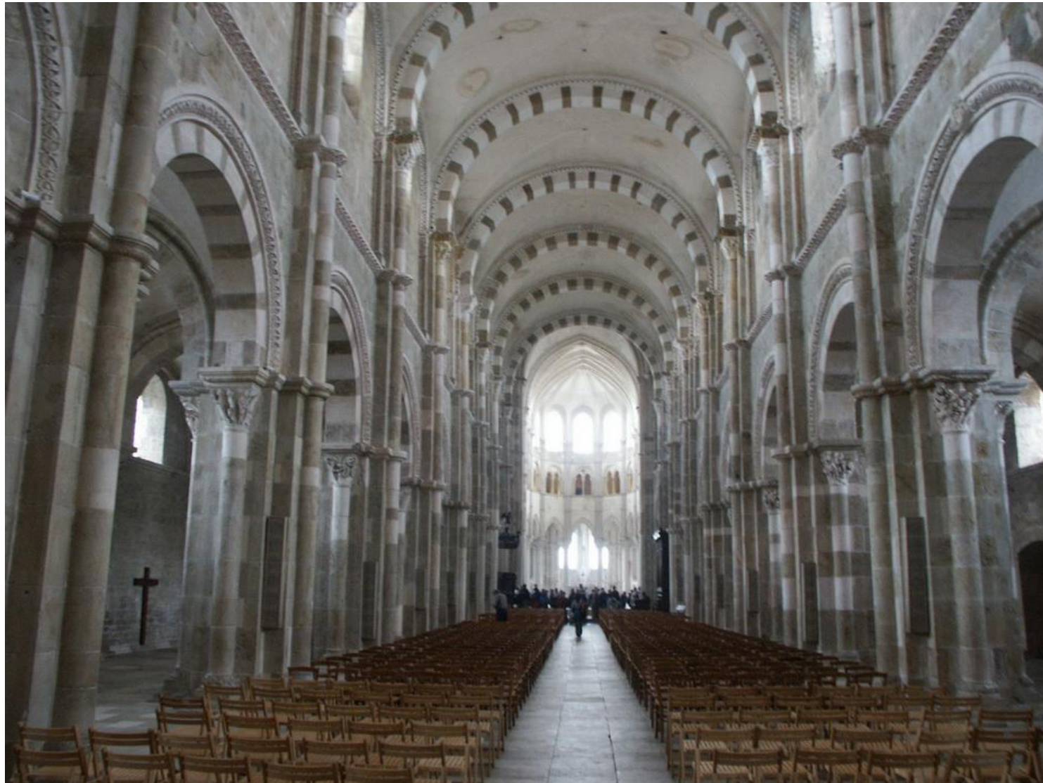
Die Basilika St. Madeleine in Vézelay, France