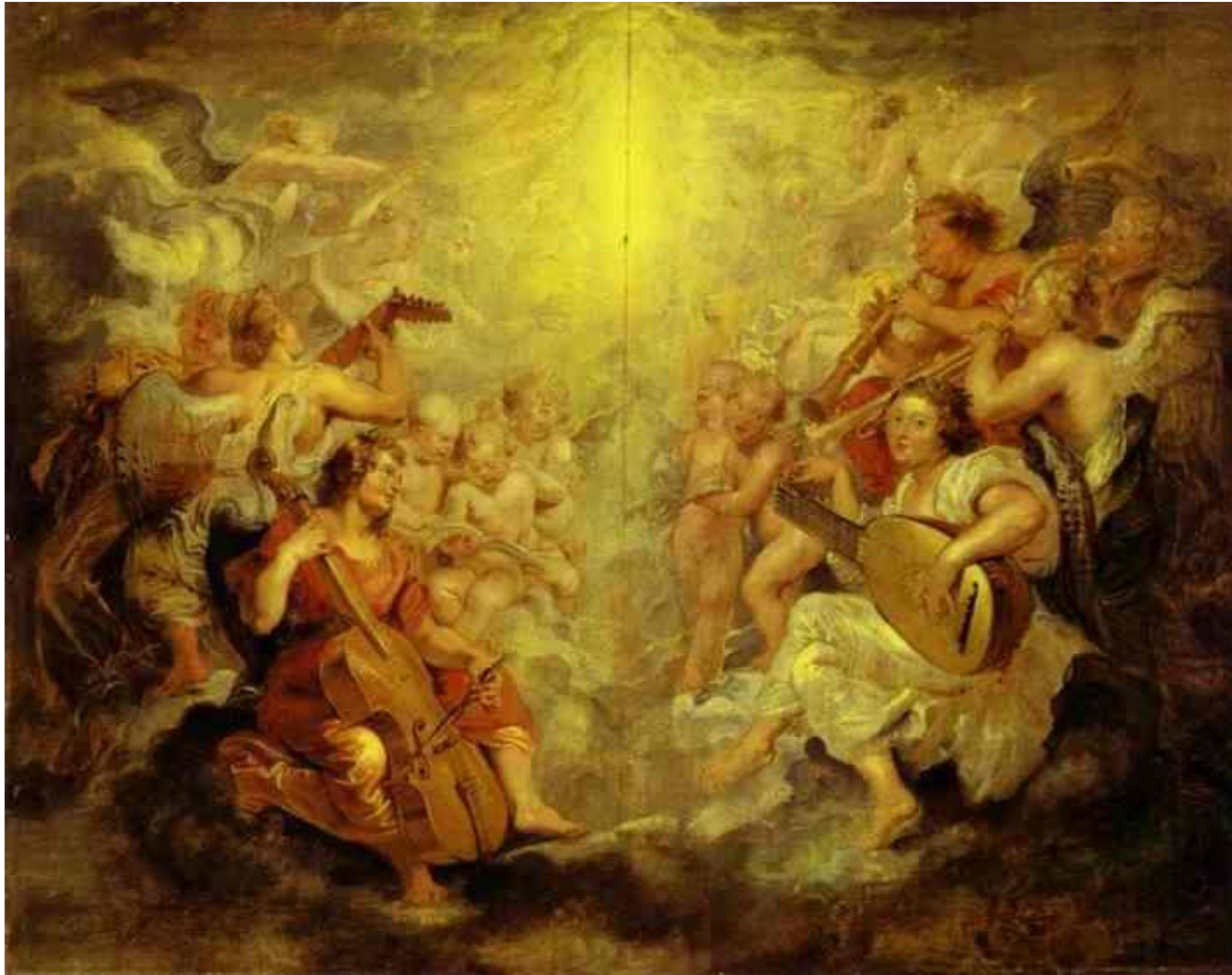
Peter Paul Rubens – Musizierende Engel