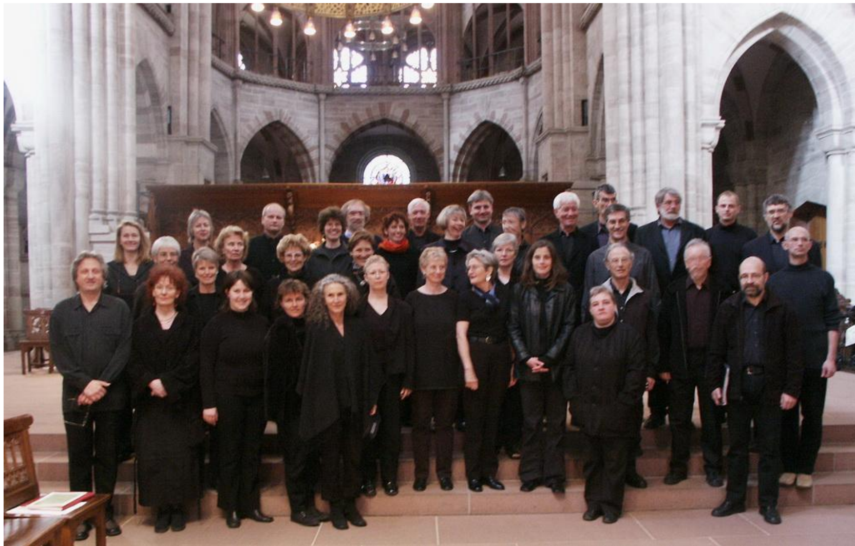
Der Cantabile Chor im Basler Münster