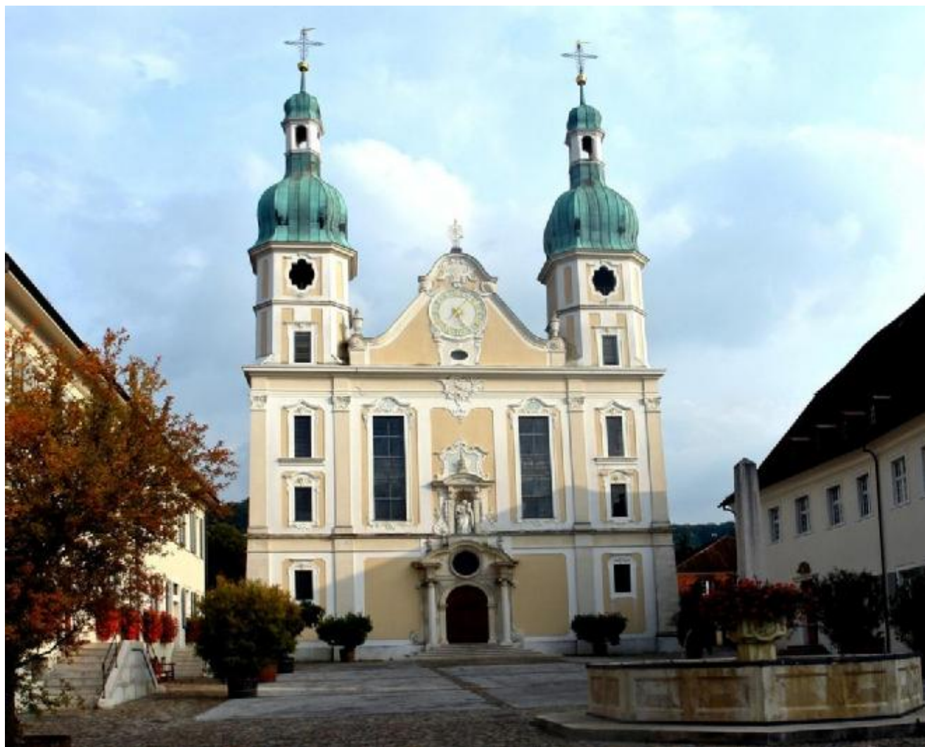
Der Dom zu Arlesheim