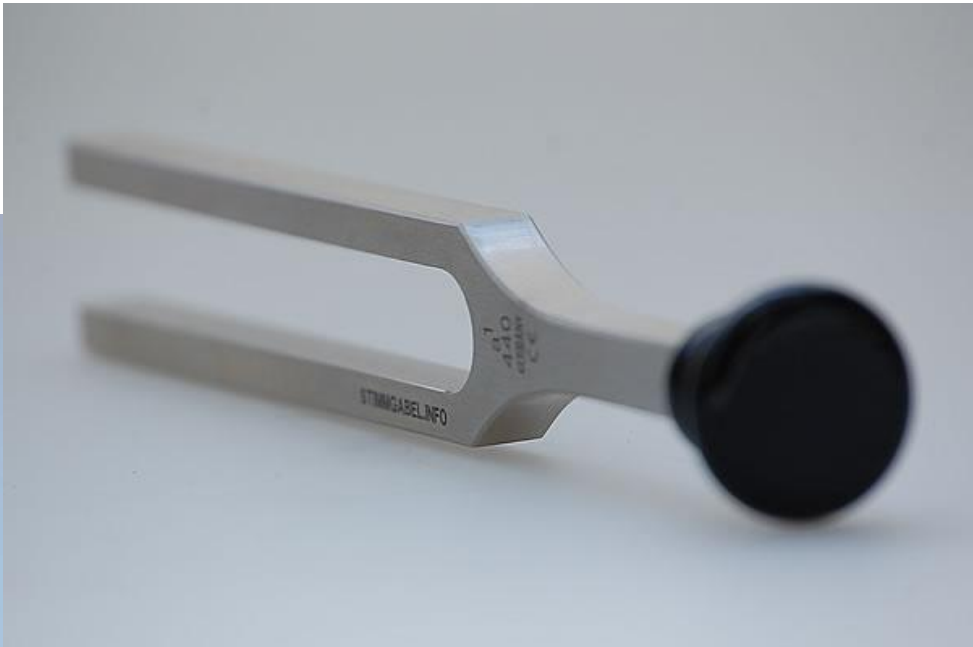
Stimmgabeln a1 440 Hz