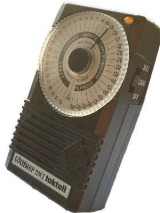
Mechanisches und elektronisches Metronom