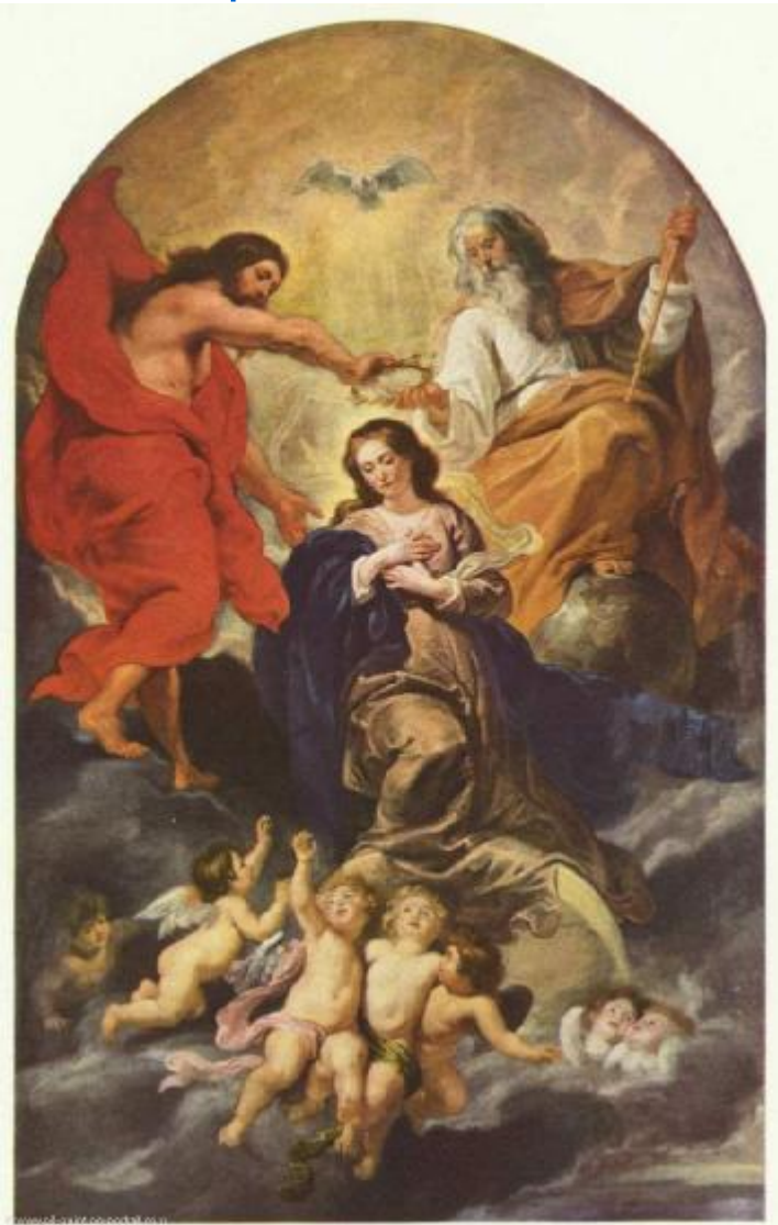
Peter Paul Rubens -Marienkrönung