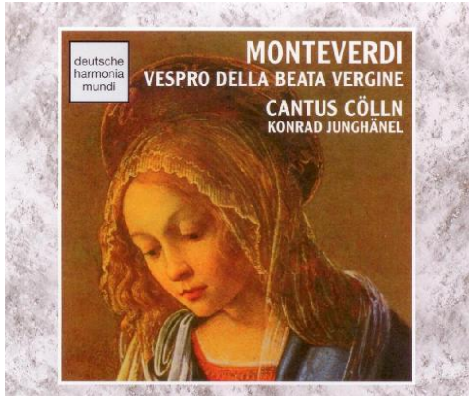
Die ‚Sieger-Aufnahme‘ Konrad Junghänel, Cantus Cölln, 1994