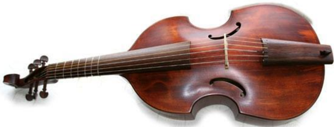
Sonur Bass – Sonur Tenor – Alt-Gambe